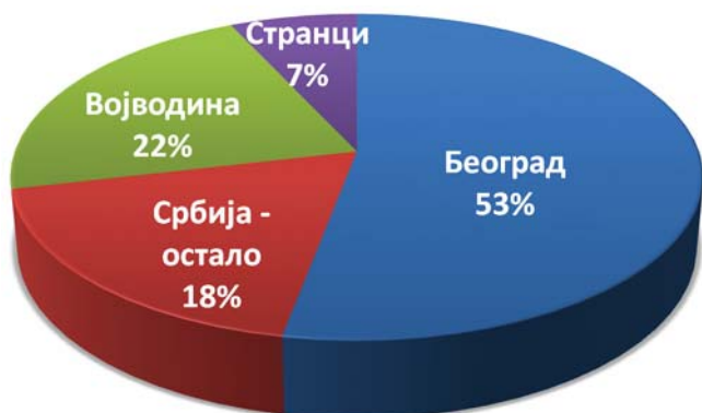
Процент регистрованих .RS домена по регионима