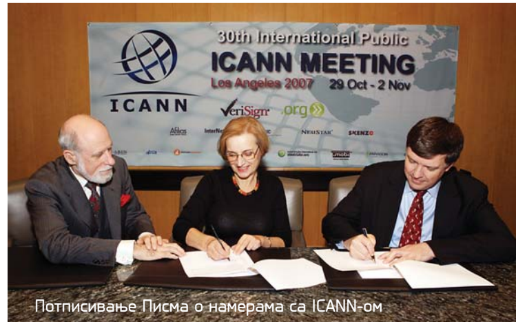
Потписивање Писма о намерама са ICANN-ом

Тренутно је регистровано скоро 60.000 .RS домена , у пет адресних простора (.rs, .co.rs, .org.rs, .in.rs и .edu.rs). Управљање адресним простором .AC.RS препуштено је Конференцији универзитета, за све акредитоване високошколске установе - факултете и институте. Адресни простор .GOV.RS , намењен државним органима Републике Србије, препуштен је на управљање Управи за заједничке послове републичких органа. Започет је процес увођења ћириличног домена.